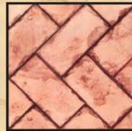
NAFPLIO / ΝΑΥΠΛΙΟ