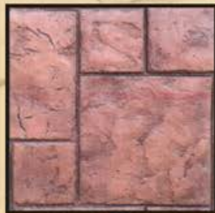
OLYMPIA / ΟΛΥΜΠΙΑ