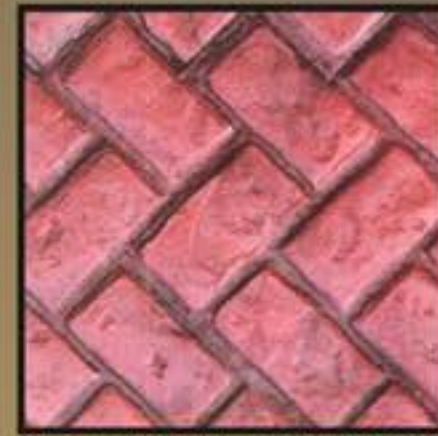
SIDE-BRICK // ΤΟΥΒΛΑΚΙ ΛΟΞΟ

Stamped concrete is an economical alternative to pavers and natural stone. When properly installed and maintained, stamped concrete will last for decades. Bonsai stamped concrete is hard to beat when it comes to pattern and color options. It looks very realistic because most stamping mats are molded from the actual materials they are designed to replicate. It is also highly resistant to color fading away due to the special color hardeners applied on top of the surface and because of the special sealers used. You will however need to maintain it. Just be cautious and have in mind the old saying "you get what you pay for". That really holds true for stamped concrete.