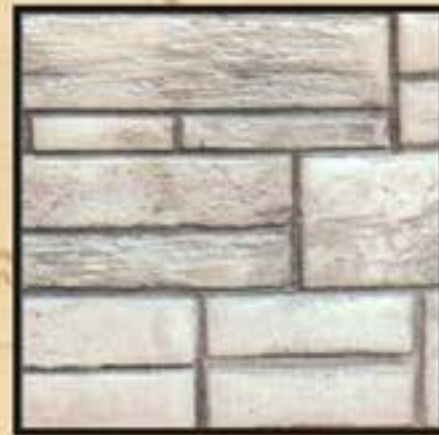
NYMFEO / ΝΥΜΦΑΙΟ