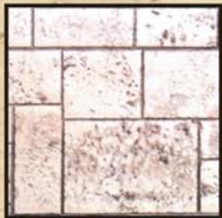
ACROPOLIS / ΑΚΡΟΠΟΛΙΣ