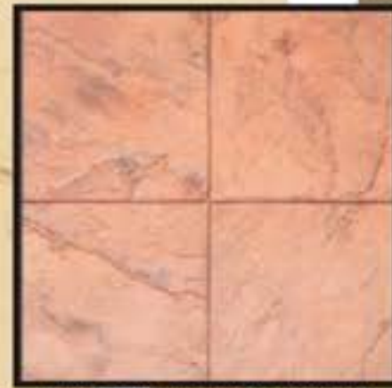
EPIDAVROS // ΕΠΙΔΑΥΡΟΣ