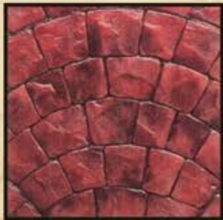
VYZANTINO / ΒΥΖΑΝΤΙΝΟ