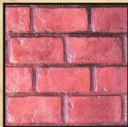
BRICK / ΤΟΥΒΛΑΚΙ