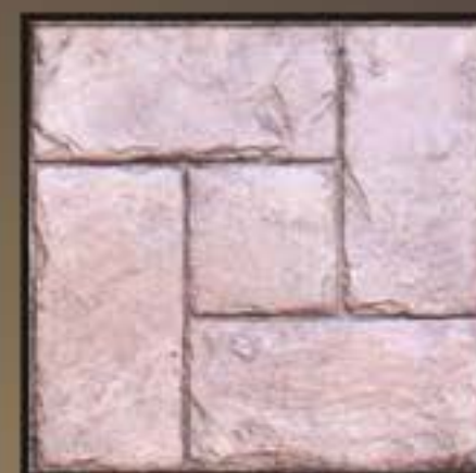
CRETE // ΚΡΗΤΗ