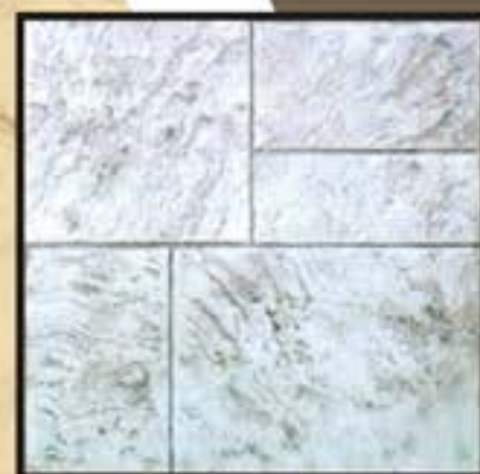
PILIO / ΠΗΛΙΟ